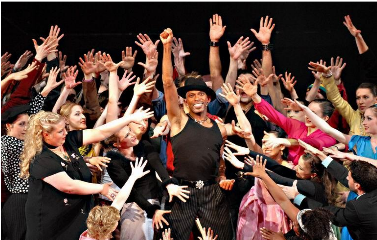
„HUD“ im HAIR _ am Theater Magdeburg(2007)___ Fotograf: HL Böhm

Tanzausbildung: an die Northwestern University , Evanston, Illinois, USA (Ballett, Jazz, Modern) ; Gus Giordano Jazzdance Chicago , Evanston, Illinois, USA (Stipendium) Alvin Ailey American Dance Center New York City, NY. (Stipendium) .....UND..., am..... David-Howard-Schule (Stipendium)....; sowie am Studio STEPS-74&B'way. .... .....mit Mike Owens (Jazz) & Wilhelm Burmann (Ballett), u.a.